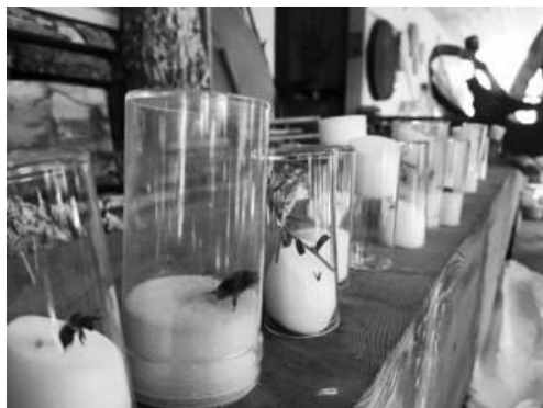
Kurs «Artenvielfalt fördern im Nutzgarten» Birgisch, 5. August 2023

Bioterra ist die führende Organisation für den Bio- und Naturgarten in der Schweiz. Wir setzen uns für den biologischen Anbau ein. Unser Engagement gilt der Förderung und dem Erhalt der einheimischen Tier- und Pflanzenwelt. Mitglieder sind interessierte Privatpersonen, Regionalgruppen, Naturgarten-Fachbetriebe sowie Biogärtnereien. www.bioterra.ch