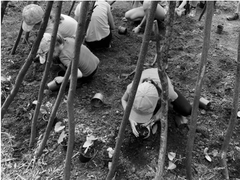
Gartenkinder pflanzen Stangenbohnen